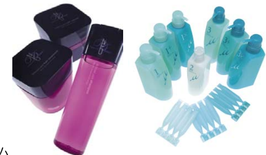
<ディーセス ノイ ドゥーエ> <リンケージ ミュー>