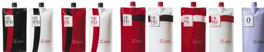
主力製品<リシオ グランフェ>