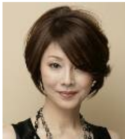
トップがふんわり 若々しいイメージに