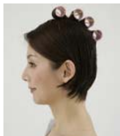
必要な部分にだけ リフュームを施術