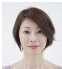
カットだけでは 華やかさが足りない