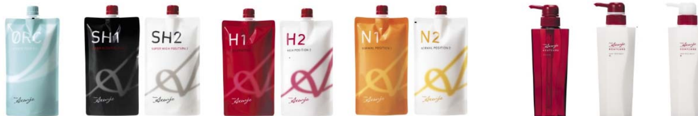
<リシオアテンジェ ストレート剤シリーズ>