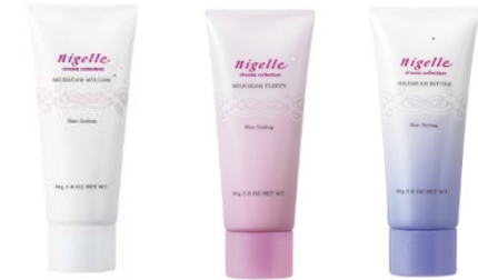
<ミルククリームシリーズ>