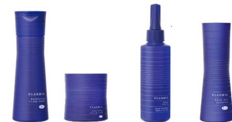
<プラーミア 新アイテム>