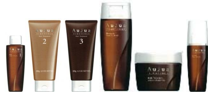
<タイムサージライン>