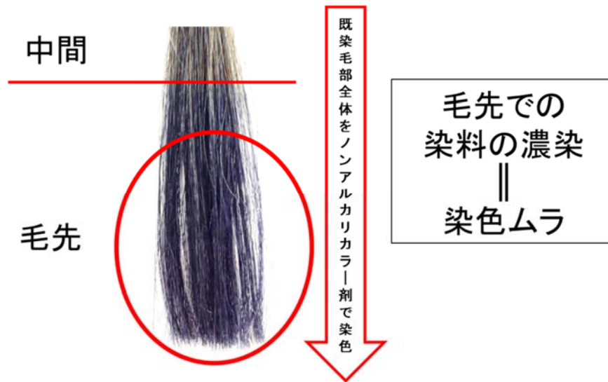
図1 ノンアルカリカラー剤で起こる典型的な毛先部の濃染

以上の結果から、茶カテキンとシルクペプチドを組み合わせることによって、毛先で起こる濃染を抑制することが出来、毛髪全体を均一に染色できるコントロール技術に繋がり、さらに茶カテキンとシルクペプチドの複合体によりダメージによって失われる毛髪内密度の向上が出来、毛髪補修効果も併せ持ったノンアルカリカラー剤の開発に至りました。