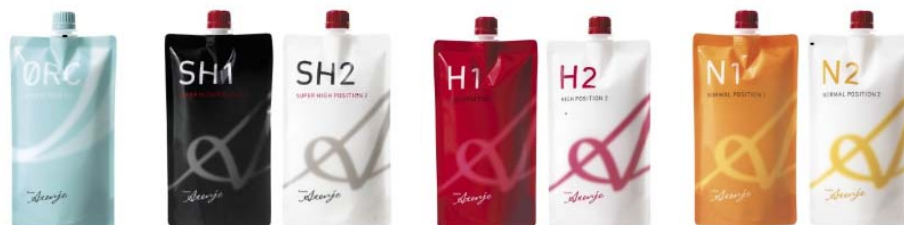
<リシオアテンジェ ストレート剤シリーズ>