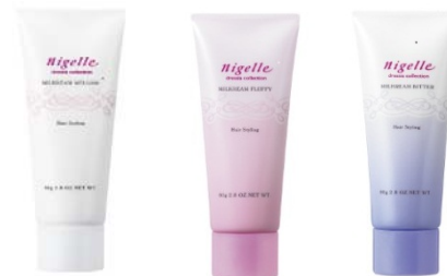
<ミルククリームシリーズ>