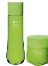
4月1日発売 くせ毛対応ヘアケア剤<フィエーリ>