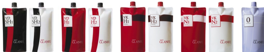
主力製品<リシオ グランフェ>