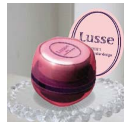
<ディーセス ルッセ>