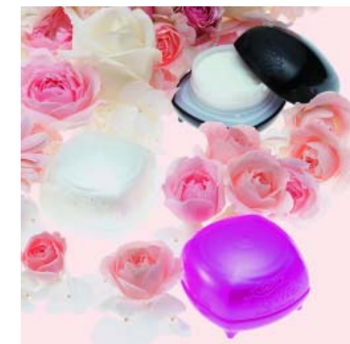
<ドレスシアコレクション ワックスシリーズ>