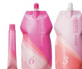
<オルディープ ボーテ>