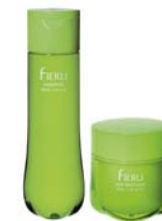
4月1日発売 くせ毛対応ヘアケア剤<フィエーリ>