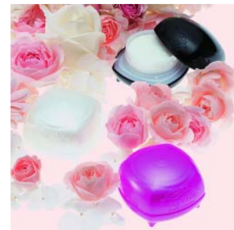
<ドレシアコレクション ワックスシリーズ>