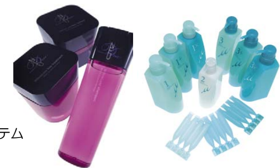
<ディーセス ノイ ドゥーエ> <リンケージ ミュー>